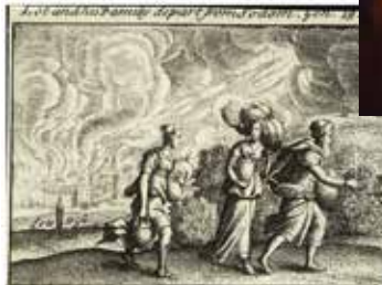
20. 6. 2018 SODOMA A GOMORA