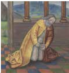
13. 6. 2018 OBŘÍZKA

Od 12. kapitoly dostává Bible zcela jiný rozměr: Bůh je popisován jako Ten, který vstupuje do osobních dějin každého člověka, jenž rozezná jeho existenci a začne ho hledat. Zpočátku mu nemusí být jasné vůbec nic než pouze to, že Bůh existuje. Tato existence pak s sebou nese další otázky, které si musí nejen Abraham vyřešit: může být jeho život stejný jako předtím, než ho poznal? Jednotlivé události ze života Abraháma nejsou předkládány chronologicky (i když se to tak při prvním čtení může zdát), ale tematicky. Nadhazují stejné nebo podobné otázky, s jakými se potýká každý, kdo uvěří v Boha. Ten totiž dává smysl všemu, tedy i hranicím lidské svobody. Jak se zachovat v různých situacích a jak vyřešit problémy, když se člověk vlastní vinou ocitne v hříchu.