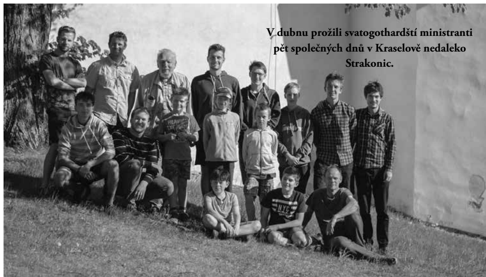
V dubnu prožili svatogothardští ministranti pět společných dnů v Kraselově nedaleko Strakoníc.

Těmito slovy začíná známá latinská modlitba Te Deum laudamus (Tebe, Bože, chválíme), připisovaná milánskému biskupovi svatému Ambrožovi, jenž ji měl složit a zazpívat u příležitosti křtu Augustina, který se po bujarém životě a intelektuálním hledání rozhodl zcela opustit světský život a zasvětit ho Ježíši Kristu. Ať už tento hymnus pochází z onoho 4. století, nebo je pozdějšího data, doloženou skutečností je, že se už ve středověku zpíval při každé významnější události jako projev díky Pánu Bohu za jeho ochranu a pomoc anebo na konci důležitého období, jakými bývá občanský nebo akademický rok. Na konci školního roku poděkujeme i u Sv. Gotharda stejným zpěvem v neděli 24. června 2018 v 10:30 .