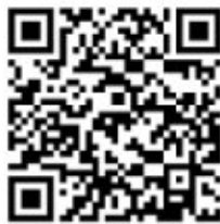
oprava elektřiny, topení a úprava sakristie

Můžete-li přispět na chod farnosti anebo na některou oblast jejích aktivit finančním darem, můžete tak učinit anonymně do některé kasičky kostela ve zdi, anebo jednorázovým či pravidelným převodem na číslo účtu 201333389/0800, vedeného v České spořitelně.