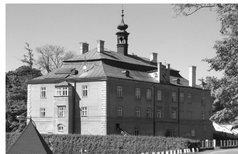
↑ zámek Dírna, sídlo jedné z větví Vratislavů z Mitrovic

Toto slovní spojení se používá v našich geografických podmínkách pro příslušníky šlechtického stavu. Na rozdíl od rolníků a jiných poddaných, kteří často pracovali nebo se pohybovali venku a měli opálenou pleť, šlechticové zejména v dětství a mládí příliš na slunce nechodili. Proto jejich pleť byla bledá a na její povrch prosvítaly modré žilky. Jelikož ostatní lidé měli krev červenou, ta šlechtická se obvyklejšímu člověku na první pohled jevila jako modrá. Jak to ale doopravdy šlechtické děti měly? A jaký byl vlastně život na zámku? I když po vzniku Československa hned jeden z prvních zákonů nového státu zakázal používat šlechtické tituly, na šlechtický stav u dědičné šlechty to nemělo žádný vliv. A tak dodnes žijí mezi námi, i když v obyčejných bytech a jejich kůže je opálená od práce na zahradě úplně stejně jako u ostatních lidí. Jedna hraběnka žije i v naší farnosti. A dnešní večer si bude na faře povídat o všem ze života šlechty nejen z vlastní zkušenosti, ale i ze zkušenosti svých předků. Už nyní prozradím, že v rodokmenu má i anglickou královnou Viktorii.