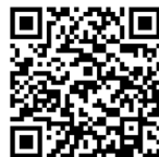
Oprava elektřiny, topení a úprava sakristie